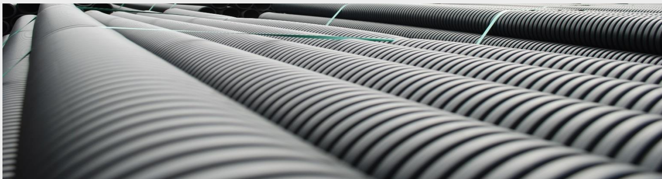
Rury dwuwarstwowe karbowane sztywne